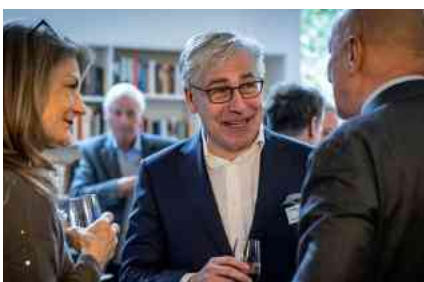
Die Lassalle-Community beim gemeinsamen Austausch.