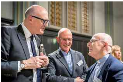
Bundesrat Martin Pfister im Gespräch mit Bischof Joseph Maria Bonnemain.